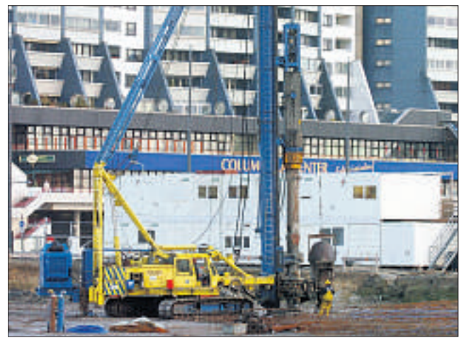
Mit viel Krawumm treibt die Ramme vor dem Columbus-Center ein langes Stahlrohr in die Erde, das dann mit Beton gefüllt wird.

Gebort – also ohne Erschütterungen und weitgehend lautlos in die Erde gedreht – werden die Pfähle nur in der Nähe der Kaje des Alten Hafens. Wo später Hotel und Klimahaus stehen, müssen die